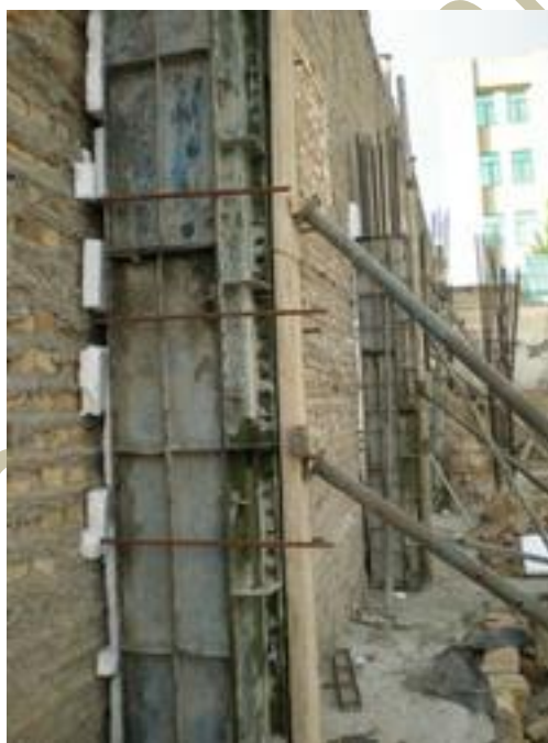
قالب بندی ستون

قبل از بستن قالب ها، تمام آنها با روغن چرب می شود، برای اینکه بعد از بتن ریزی قالب که باز می شود گوشه های بتن بر اثر باز شدن قالب و داشتن گوشه کنده نشود.