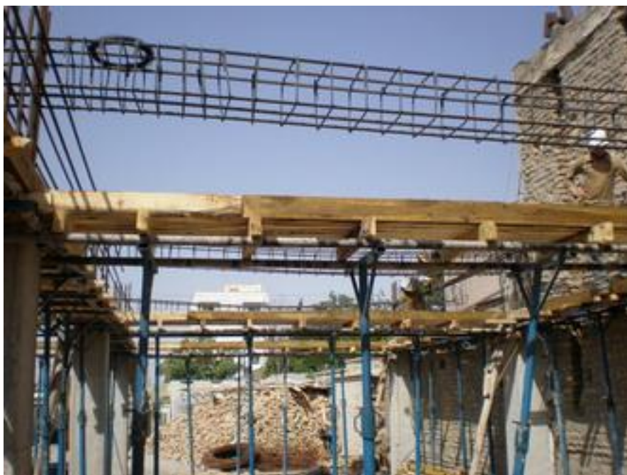
کف کشی زیر تیر