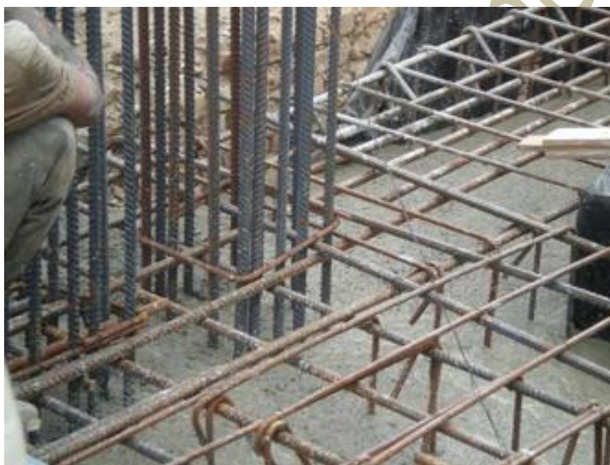
بتن ریزی فونداسیون

تماس نداشتن با خاک ۷ تا ۵ سانتی متر بود.