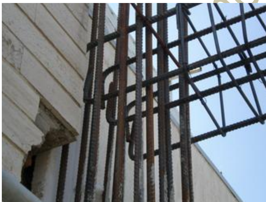
روش اتصال تیر به ستون

بعد از پخش کردن خاموتها در محل خود بسته شدند هم زمان با اجرای تیرها تیرچه های سقف در حیاط ساختمان در محلی که یک باند بتنی اجرا شده بود در حال ساخته شدن بود.