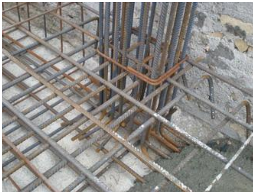
روش قرار گرفتن ستون در پی