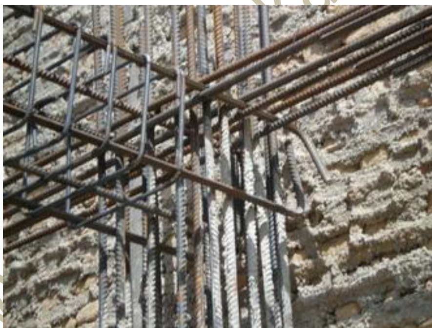
اتصال تیرها به ستون