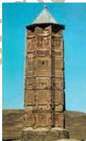
مناره ی غزنویان، غزنویان، افغانستان